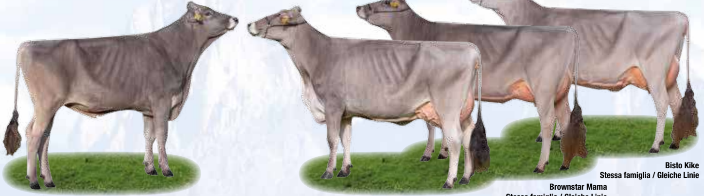
Bisto Kike Stessa famiglia / Gleiche Linie