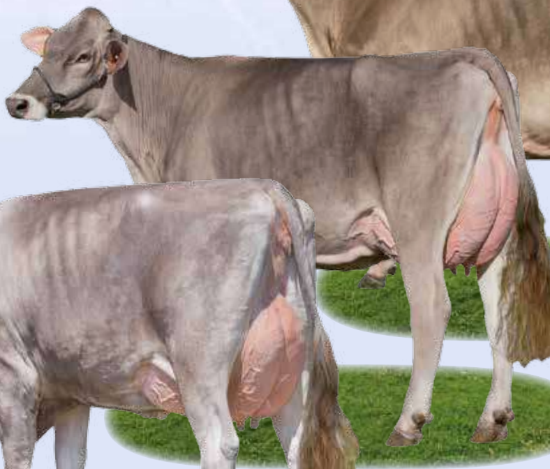
Superstar Regina - Zia / Tante