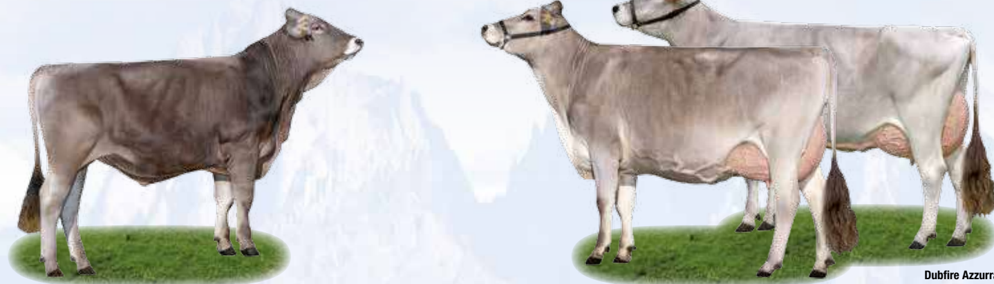
Dubfire Azzurra Madre / Mutter

Allev. / Züchter: Az. Agr. Bodengo, Morbegno (SO)