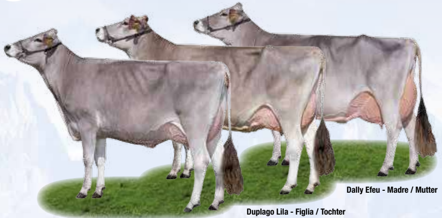
Dally Efeu - Madre / Mutter