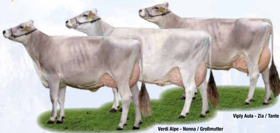
Viply Aula - Zia / Tante