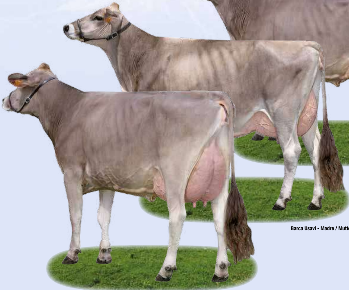
Barca Usavi - Madre / Mutter