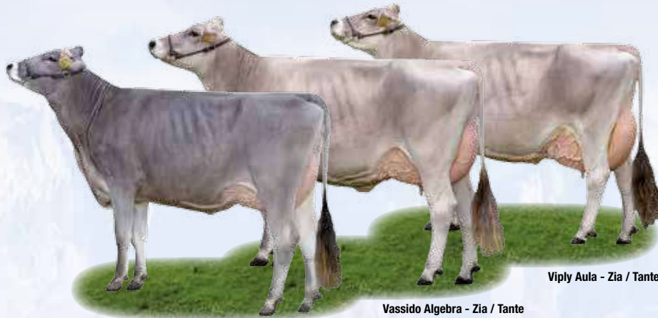
Viply Aula - Zia / Tante