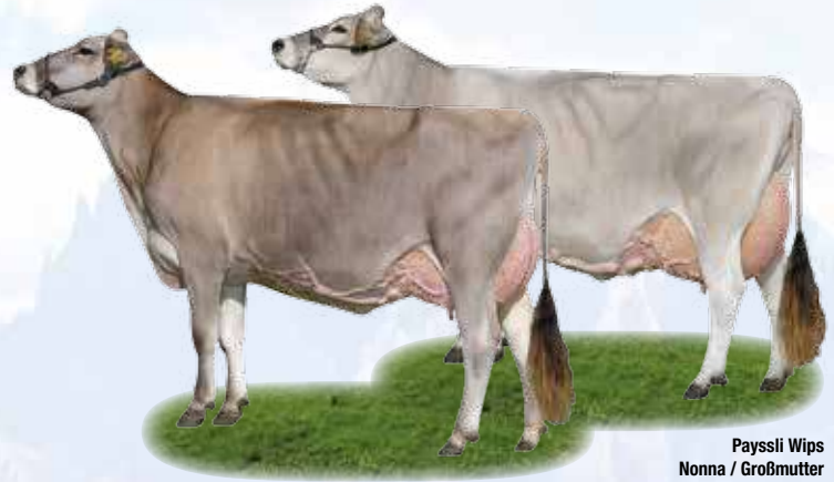
Payssli Wips Nonna / Großmutter