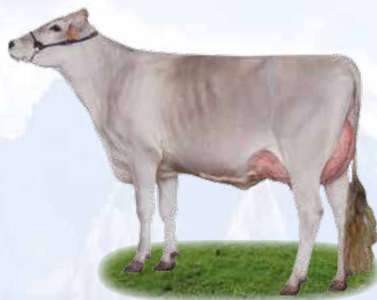
Vastness Ostra - Madre / Mutter