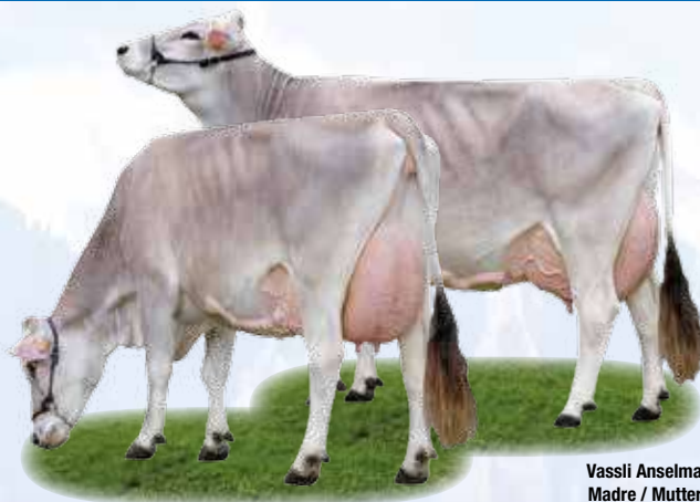
Vassli Anselma Madre / Mutter

Allev. / Züchter: Az. Agr. Bodengo, Morbegno (SO)