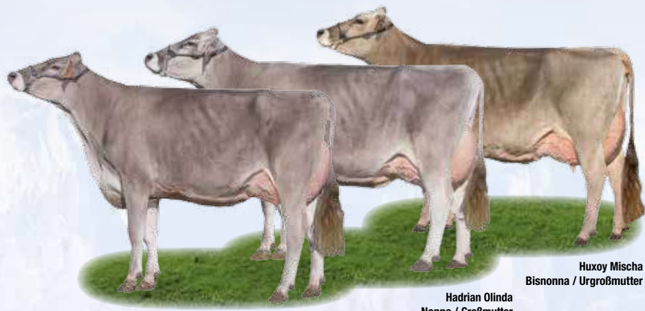
Huxoy Mischa Bisnonna / Urgroßmutter