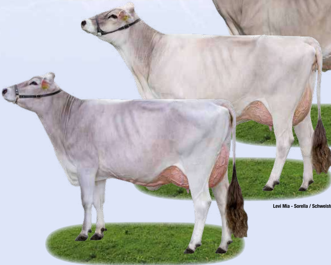
Biver Mause Nonna / Großmutter