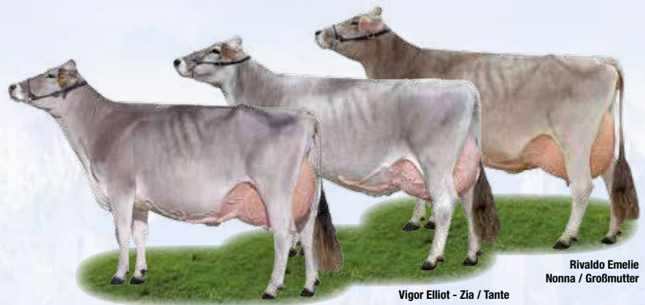
Rivaldo Emelie Nonna / Großmutter