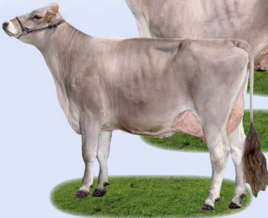
Viplý Aula - Madre / Mutter