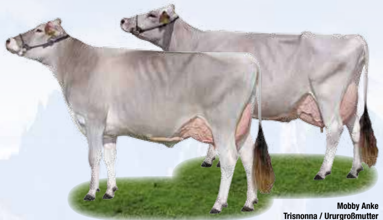
Mobby Anke Trisnonna / Ururgroßmutter