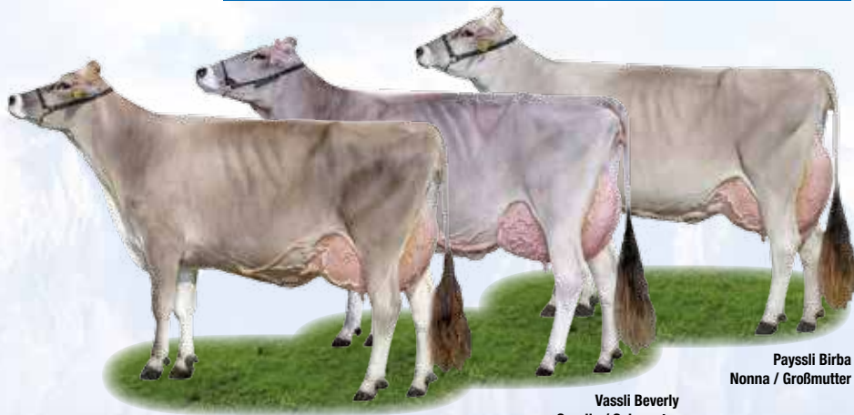
Payslli Birba Nonna / Großmutter