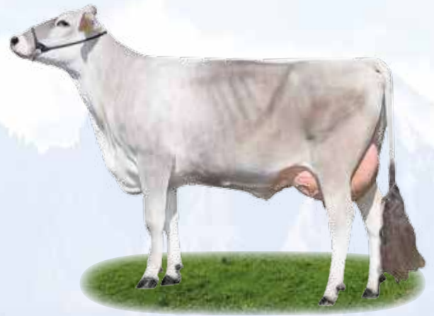
Canyon Ellen - Stessa famiglia / Gleiche Familie