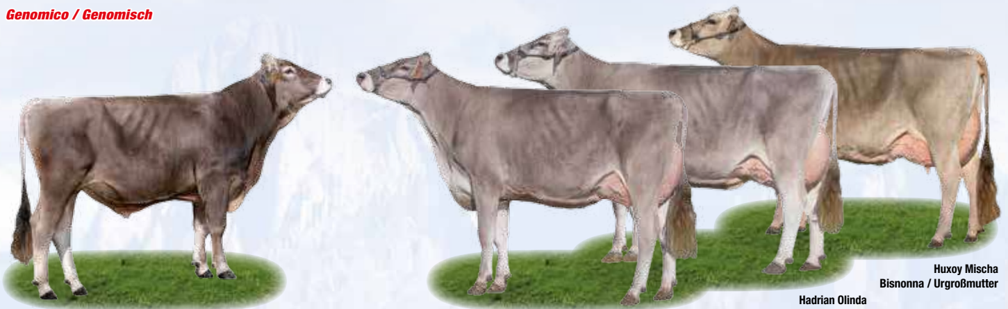
Huxoy Mischa Bisnonna / Urgroßmutter