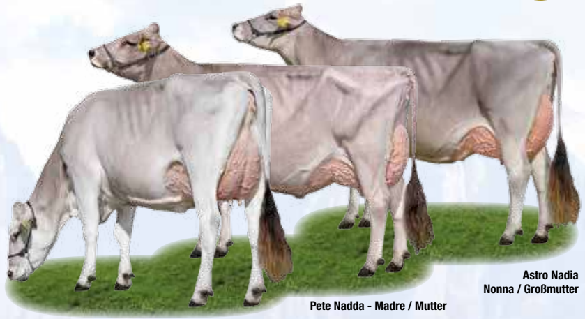
Astro Nadia Nonna / Großmutter