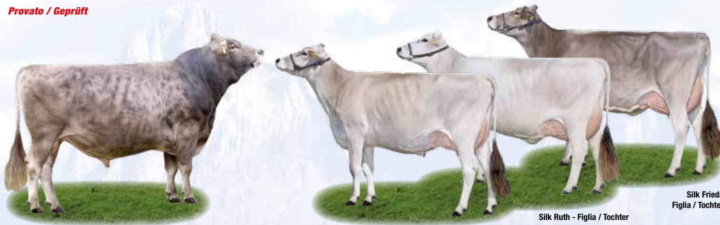
Silk Frieda Figlia / Tochter