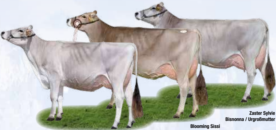
Zaster Sylvie Bisnonna / Urgroßmutter