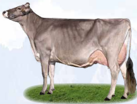
Hunter Ance - Madre / Mutter