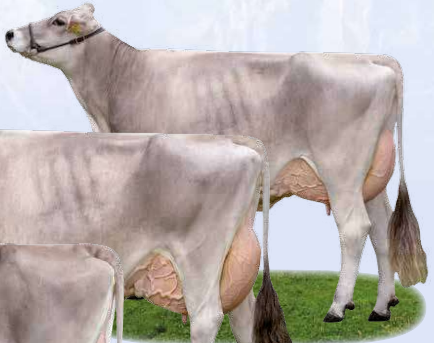
Vassido Algebra - Zia / Tante