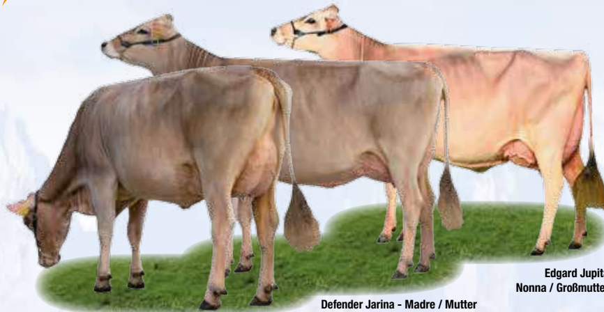
Edgard Jupita Nonna / Großmutter