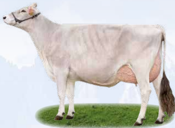
Assay Emmi - Cugina / Cousine