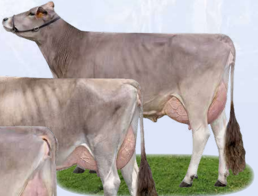
Superstar Spilla - Nonna / Großmutter